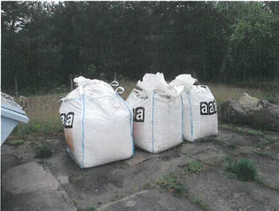
Bild 1: Großaufnahme Big-Pag gefüllt mit Steinmehlrückständen MP3