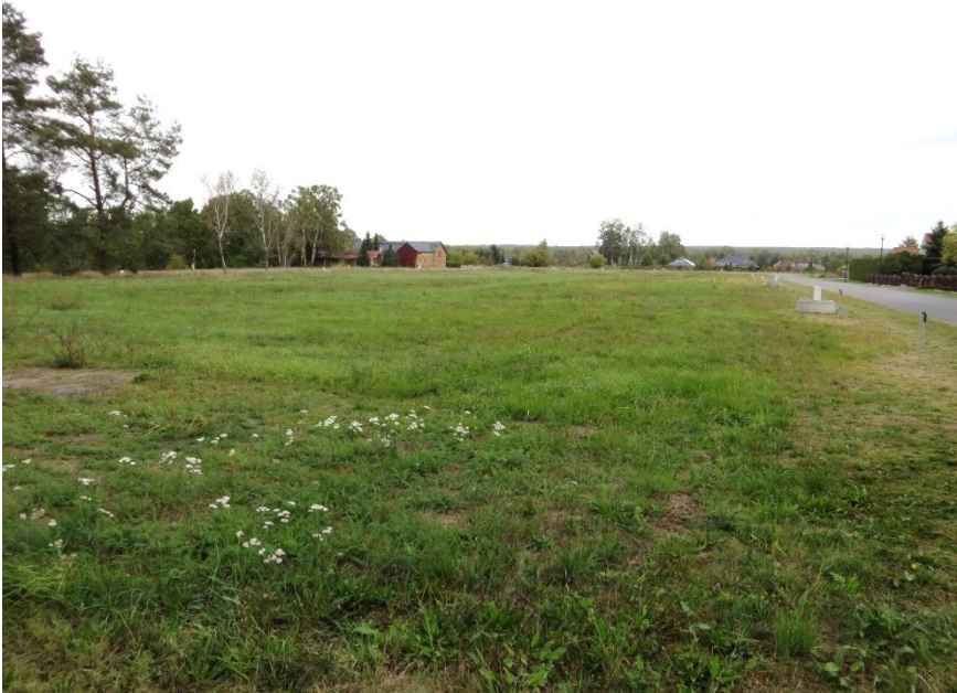
Blick auf das Grundstück in nördliche Richtung