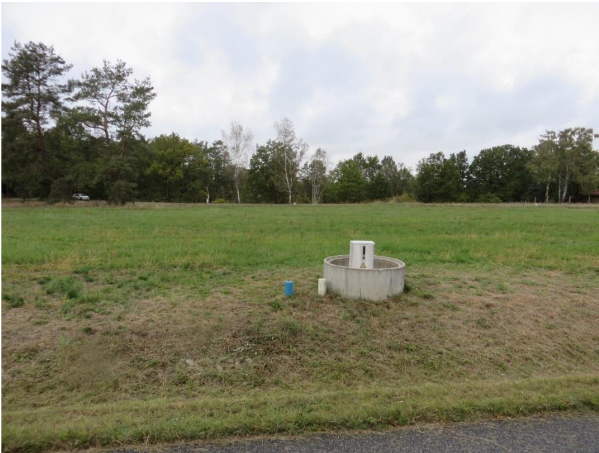
Blick auf das Grundstück von der Straße Zur Windmühle