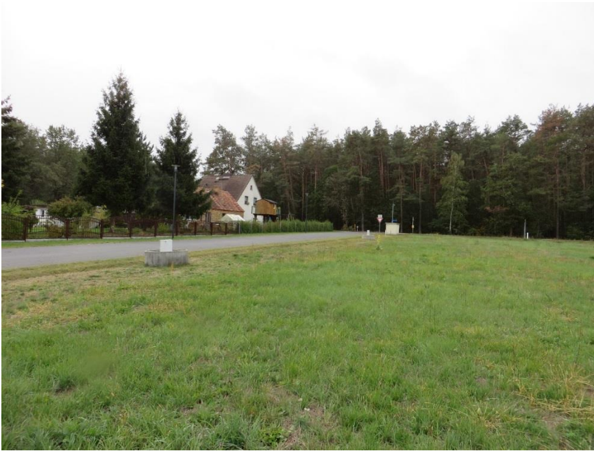
Blick vom Grundstück auf die Straße Zur Windmühle