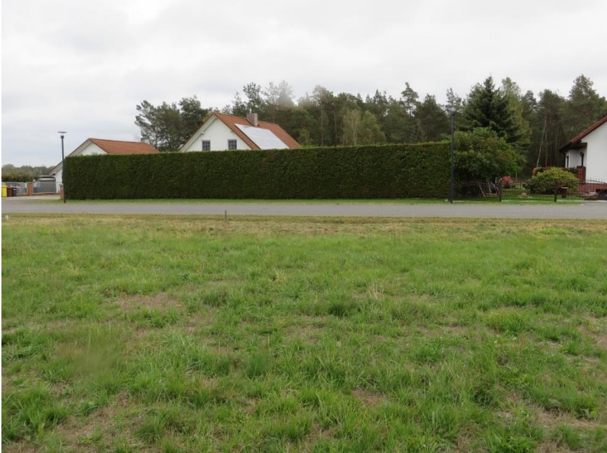
Blick vom Grundstück auf die Straße Zur Windmühle