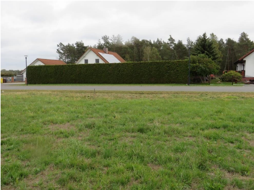
Blick vom Grundstück auf die Straße Zur Windmühle