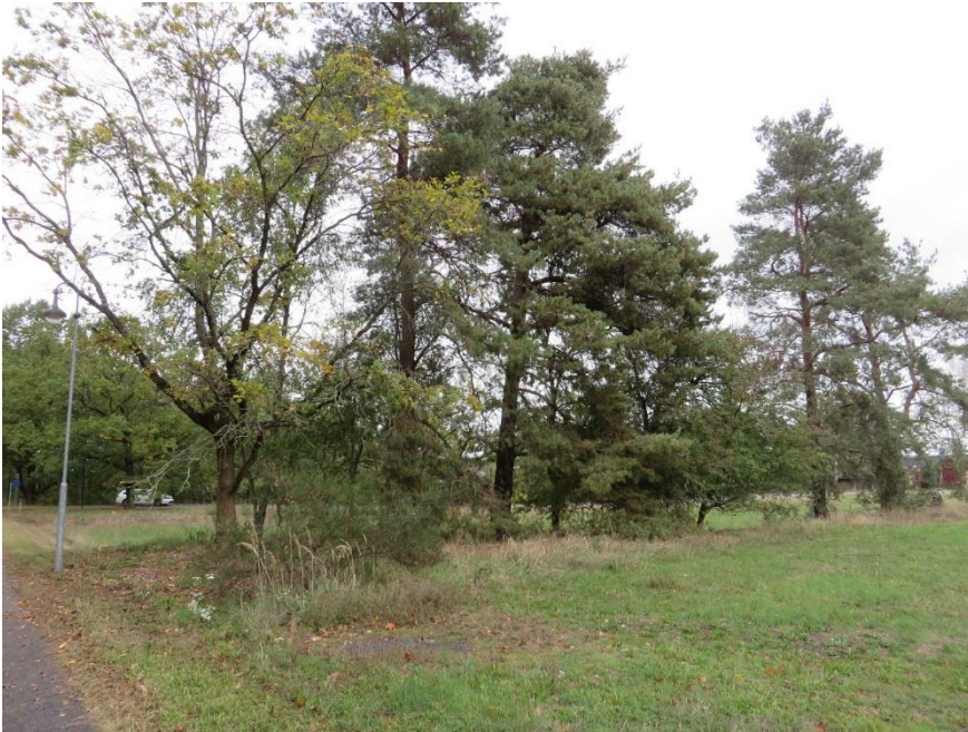
Blick auf das Grundstück mit kleiner Anhöhe und Baumbestand