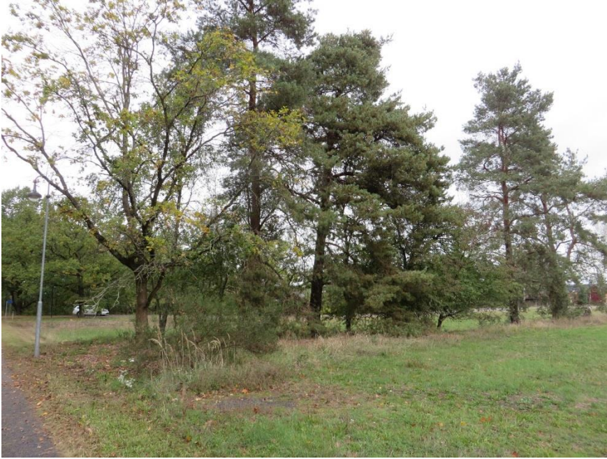
Blick auf das Grundstück mit kleiner Anhöhe und Baumbestand