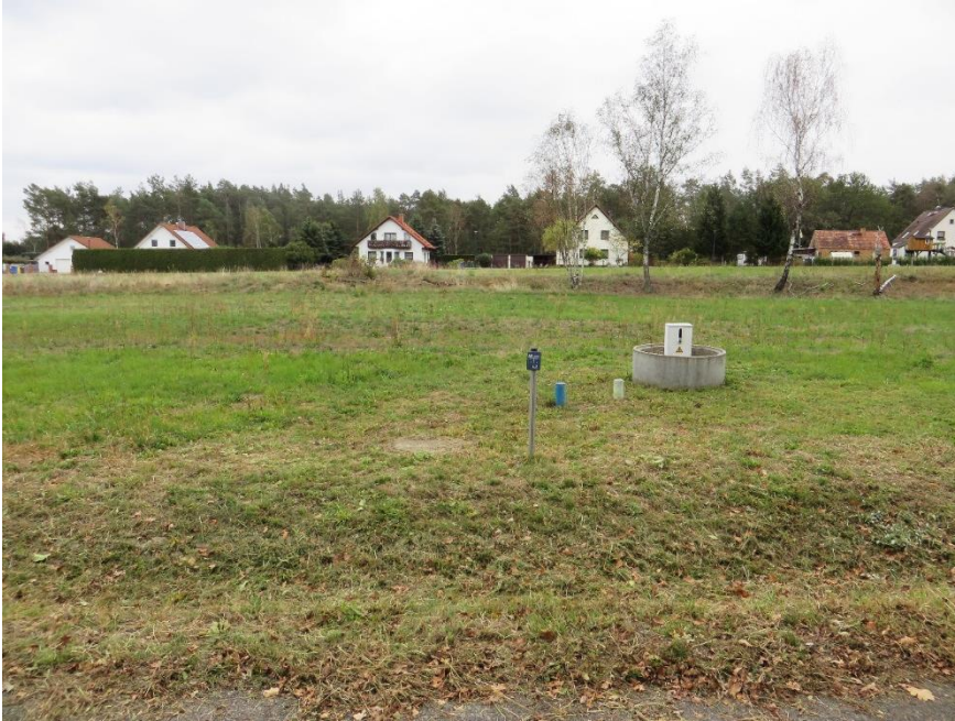
Blick auf das Grundstück