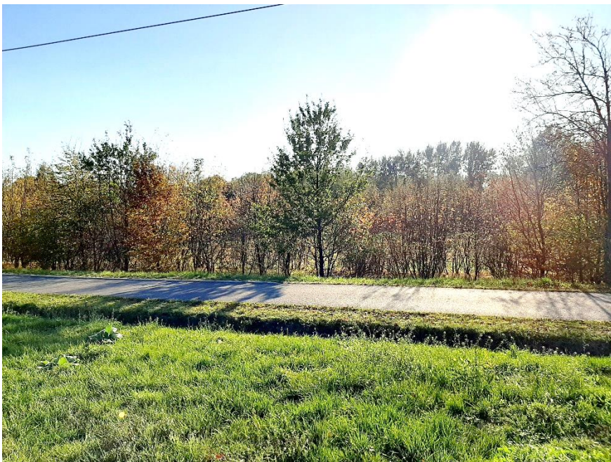
Blick in die Umgebung

Bei der Veröffentlichung handelt es sich um eine für die Lausitz Energie Bergbau AG (LE-B) unverbindliche Bekanntgabe zur Abgabe Ihrer Interessensbekundung. Wir weisen darauf hin, dass für die Richtigkeit der Angaben keine Gewähr übernommen wird. Die LE-B behält sich die volle Entscheidungsfreiheit darüber vor, ob, wann, an wen, in welchem Umfang und zu welchen Bedingungen das Grundstück veräußert wird.