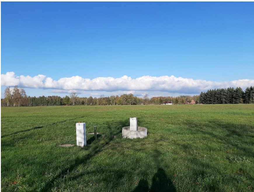
Blick auf das Grundstück