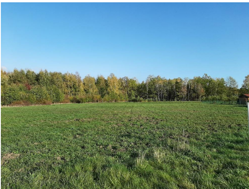
Blick auf das Grundstück

Bei der Veröffentlichung handelt es sich um eine für die Lausitz Energie Bergbau AG (LE-B) unverbindliche Bekanntgabe zur Abgabe Ihrer Interessensbekundung. Wir weisen darauf hin, dass für die Richtigkeit der Angaben keine Gewähr übernommen wird. Die LE-B behält sich die volle Entscheidungsfreiheit darüber vor, ob, wann, an wen, in welchem Umfang und zu welchen Bedingungen das Grundstück veräußert wird.