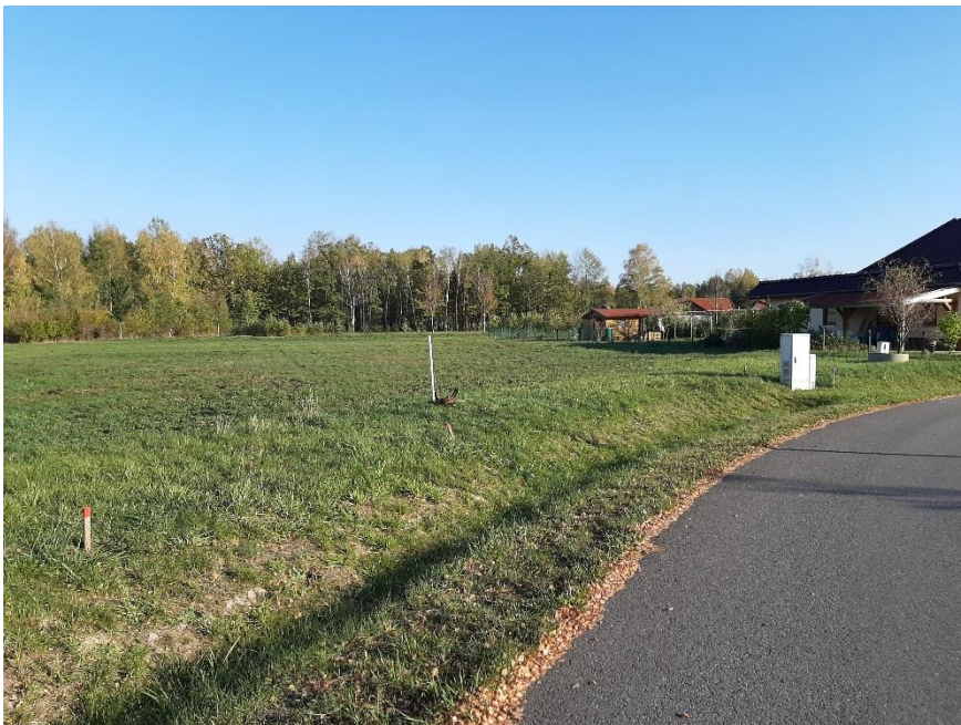
Blick auf das Grundstück