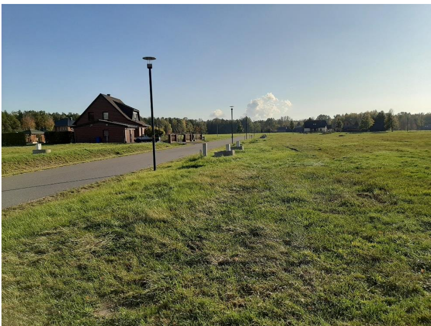
Blick in die Umgebung

Bei der Veröffentlichung handelt es sich um eine für die Lausitz Energie Bergbau AG (LE-B) unverbindliche Bekanntgabe zur Abgabe Ihrer Interessensbekundung. Wir weisen darauf hin, dass für die Richtigkeit der Angaben keine Gewähr übernommen wird. Die LE-B behält sich die volle Entscheidungsfreiheit darüber vor, ob, wann, an wen, in welchem Umfang und zu welchen Bedingungen das Grundstück veräußert wird.