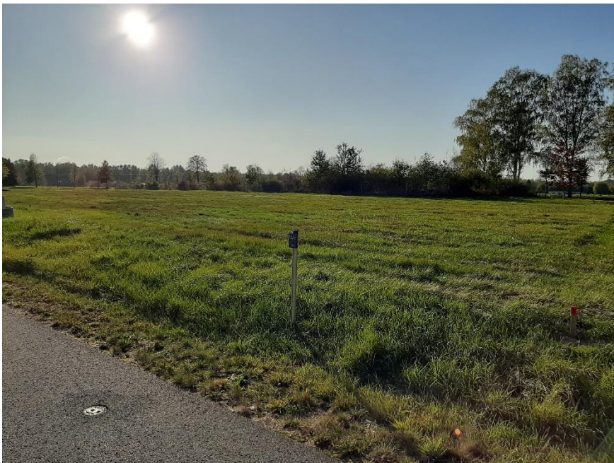
Blick auf das Grundstück