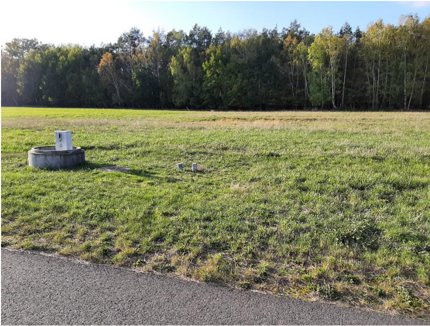
Blick vom Kranichweg auf das Grundstück