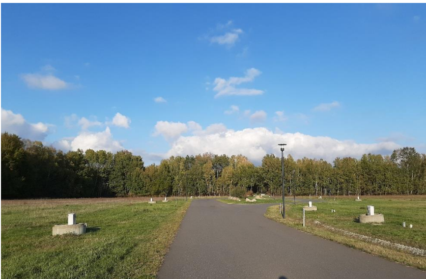
Blick vom Kranichweg auf die Grundstücke K10, K11 und K12 (links) in Richtung Halbendorfer See

Bei der Veröffentlichung handelt es sich um eine für die Lausitz Energie Bergbau AG (LE-B) unverbindliche Bekanntgabe zur Abgabe Ihrer Interessensbekundung. Wir weisen darauf hin, dass für die Richtigkeit der Angaben keine Gewähr übernommen wird. Die LE-B behält sich die volle Entscheidungsfreiheit darüber vor, ob, wann, an wen, in welchem Umfang und zu welchen Bedingungen das Grundstück veräußert wird.