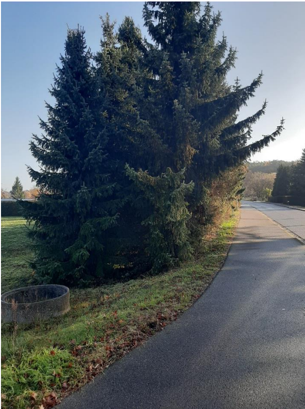
Blick auf die Tiergartenstraße mit Fichtenreihe auf dem Grundstück

Bei der Veröffentlichung handelt es sich um eine für die LandWerte Immobilien & Entwicklung GmbH & Co. KG. unverbindliche Bekanntgabe zur Abgabe Ihrer Interessensbekundung. Wir weisen darauf hin, dass für die Richtigkeit der Angaben keine Gewähr übernommen wird. Die LandWerte Immobilien & Entwicklung GmbH & Co. KG. behält sich die volle Entscheidungsfreiheit darüber vor, ob, wann, an wen, in welchem Umfang und zu welchen Bedingungen das Grundstück veräußert wird.