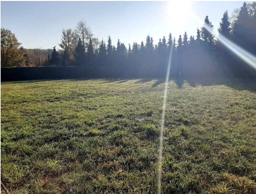
Blick auf das Grundstück