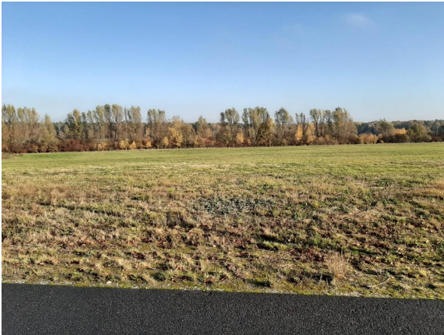
Blick auf das Grundstück