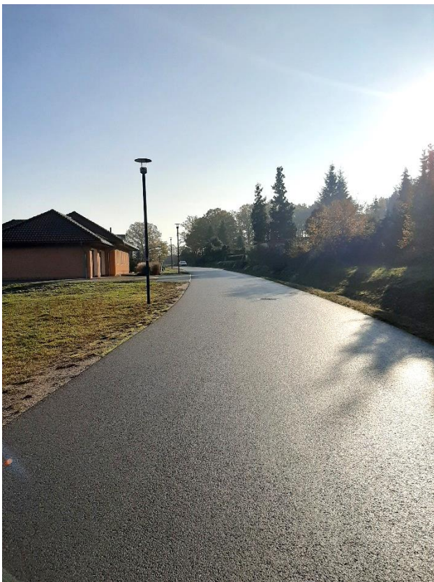
Blick in die Umgebung (Straße Hinterberg)

Bei der Veröffentlichung handelt es sich um eine für die Lausitz Energie Bergbau AG (LE-B) unverbindliche Bekanntgabe zur Abgabe Ihrer Interessensbekundung. Wir weisen darauf hin, dass für die Richtigkeit der Angaben keine Gewähr übernommen wird. Die LE-B behält sich die volle Entscheidungsfreiheit darüber vor, ob, wann, an wen, in welchem Umfang und zu welchen Bedingungen das Grundstück veräußert wird.