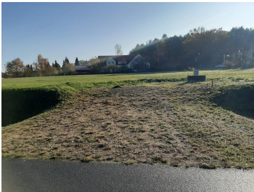
Zufahrt zum Grundstück