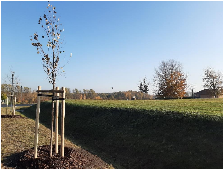
Blick auf das Grundstück (Graben an der Nordwestseite des Grundstücks)