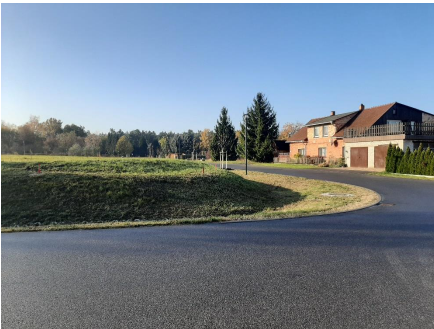
Blick auf das Grundstück (Graben an der Nordseite des Grundstücks und Straßenbereich)

Bei der Veröffentlichung handelt es sich um eine für die LandWerte Immobilien & Entwicklung GmbH & Co. KG. unverbindliche Bekanntgabe zur Abgabe Ihrer Interessensbekundung. Wir weisen darauf hin, dass für die Richtigkeit der Angaben keine Gewähr übernommen wird. Die LandWerte Immobilien & Entwicklung GmbH & Co. KG. behält sich die volle Entscheidungsfreiheit darüber vor, ob, wann, an wen, in welchem Umfang und zu welchen Bedingungen das Grundstück veräußert wird.