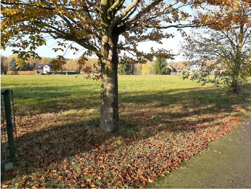
Blick auf das Grundstück