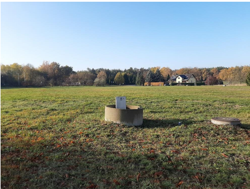
Blick auf das Grundstück

Bei der Veröffentlichung handelt es sich um eine für die LandWerte Immobilien & Entwicklung GmbH & Co. KG. unverbindliche Bekanntgabe zur Abgabe Ihrer Interessensbekundung. Wir weisen darauf hin, dass für die Richtigkeit der Angaben keine Gewähr übernommen wird. Die LandWerte Immobilien & Entwicklung GmbH & Co. KG. behält sich die volle Entscheidungsfreiheit darüber vor, ob, wann, an wen, in welchem Umfang und zu welchen Bedingungen das Grundstück veräußert wird.