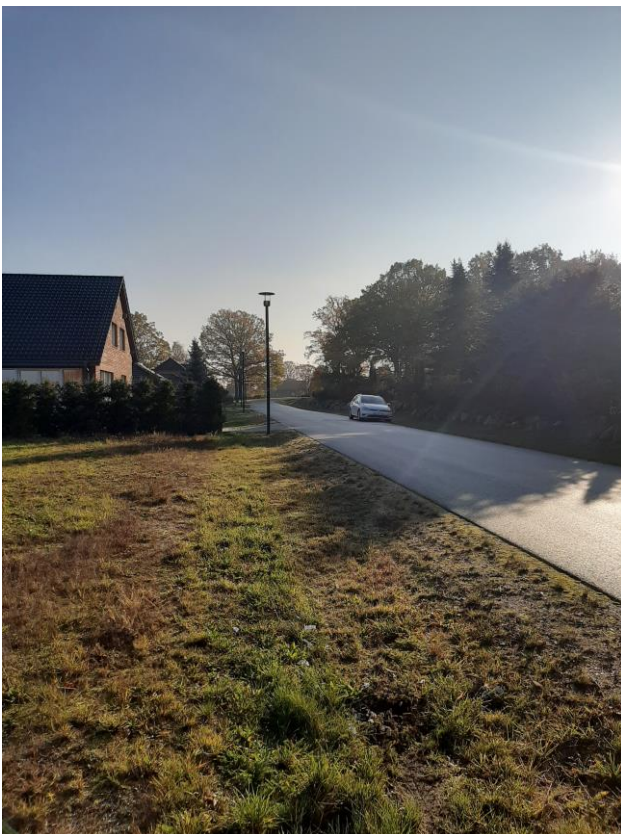
Blick in die Umgebung (Straße Hinterberg)

Bei der Veröffentlichung handelt es sich um eine für die Lausitz Energie Bergbau AG (LE-B) unverbindliche Bekanntgabe zur Abgabe Ihrer Interessensbekundung. Wir weisen darauf hin, dass für die Richtigkeit der Angaben keine Gewähr übernommen wird. Die LE-B behält sich die volle Entscheidungsfreiheit darüber vor, ob, wann, an wen, in welchem Umfang und zu welchen Bedingungen das Grundstück veräußert wird.