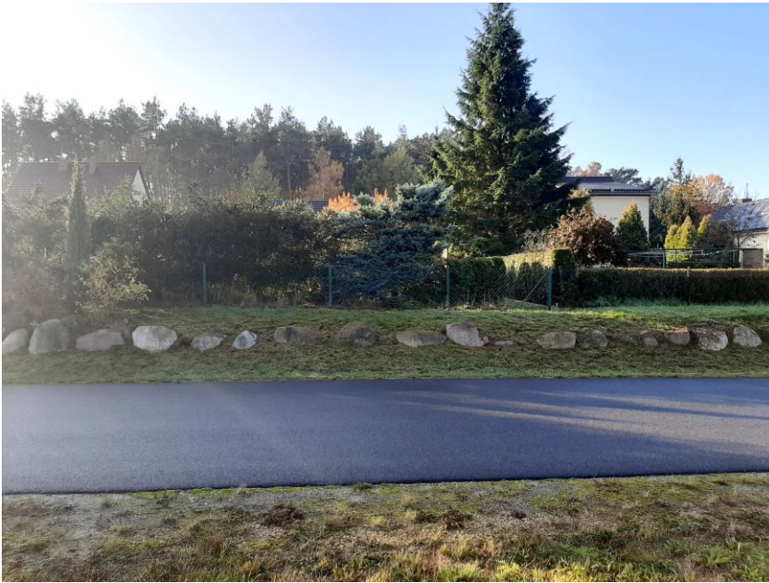
Blick auf das gegenüberliegende Grundstück