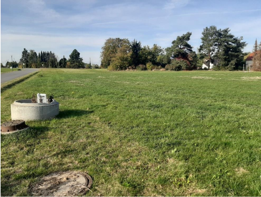
Blick vom Grundstück in westliche Richtung