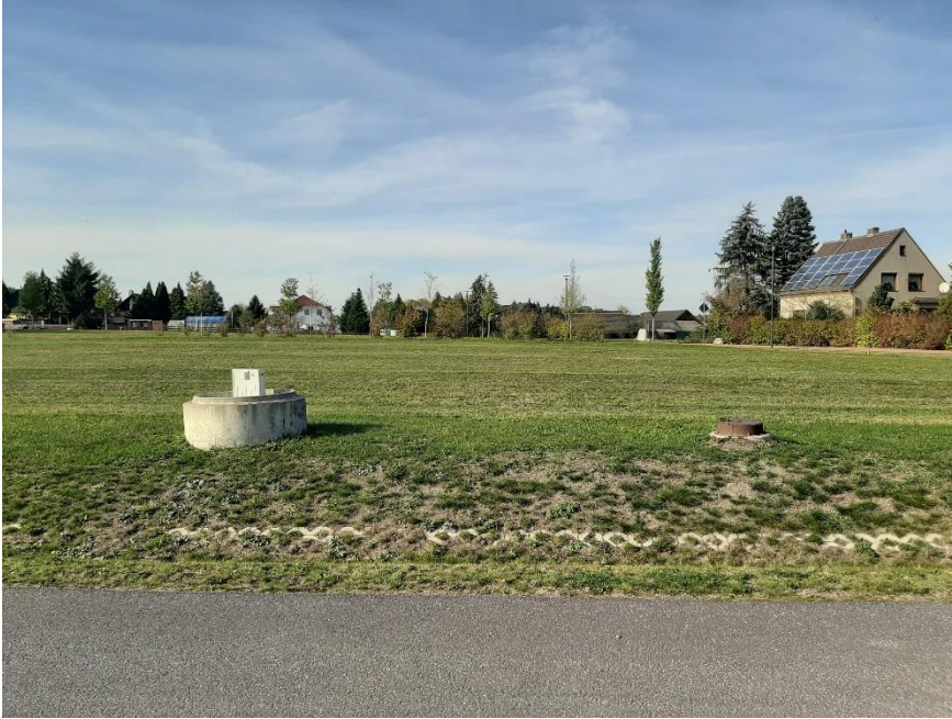
Blick von der Straße „Grüne Aue“ auf das Grundstück