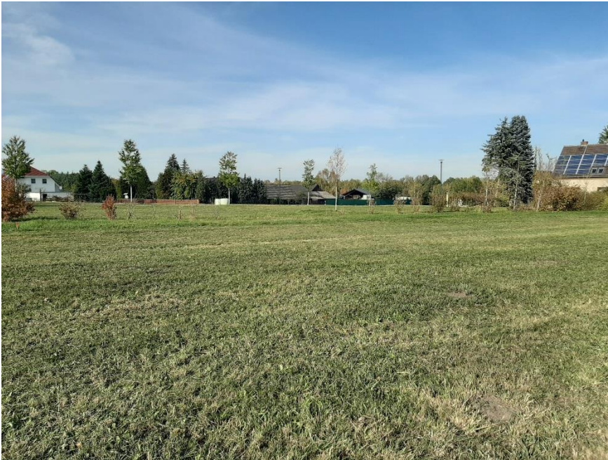
Blick von der Straße „Grüne Aue“ auf das Grundstück